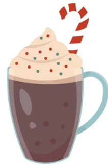
Un chocolat chaud